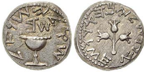
Figura 1. Shekel. Moneda de Mesopotamia 1.000 a.c.

Otro sistema de contabilidad fue el cuneiforme y de hecho también era el sistema de registro de esa época. Esta fotografía (figura 2) particularmente es una transacción para la venta de un terreno, es decir que los registros de contabilidad datan de más allá del código de Hammurabi que es el sistema legal.