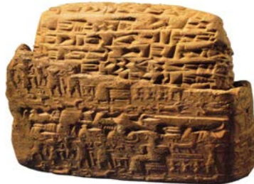
Figura 2. Registro de contabilidad cuneiforme mesopotámico

Han existido miles de estos artefactos alrededor del mundo, los he visto en el Metropolitan Museum of Art en Nueva York, en París, en el British Museum. Hammurabi fue un rey que existió en la región de Mesopotamia alrededor del año 1.000 a.c y este código particular, es un código legal que está escrito en basalto negro y está ubicado en el Museo de Louvre en París; trata, entre otras cosas, con transacciones corrientes y cotidianas de un negocio, como por ejemplo cuanto debería cobrar un peluquero por un corte de pelo.