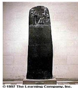
Figura 3. Normas legales y contables del Código de Hammurabi 1.000 a.c.