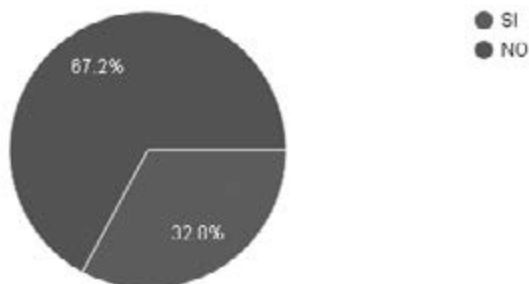
Figura 3. ¿Se garantiza independencia mental en el desarrollo de las funciones?