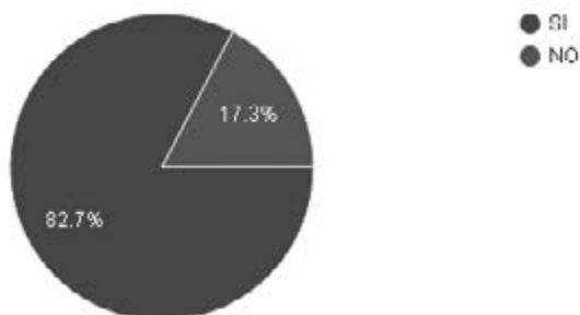
Figura 2. ¿Considera que el desempeño del Contador Público se ve afectado por los intereses particulares de la empresa privada?

El 70,5% manifiesta que no se evidencia un respaldo del Estado hacia el contador, su experiencia profesional demuestra desacuerdo con el Ejercicio del Estado y esto representa el no contar con un apoyo institucional.